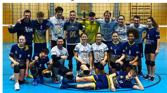
unsere beiden Innviertel-Mixed-Cup Teams.